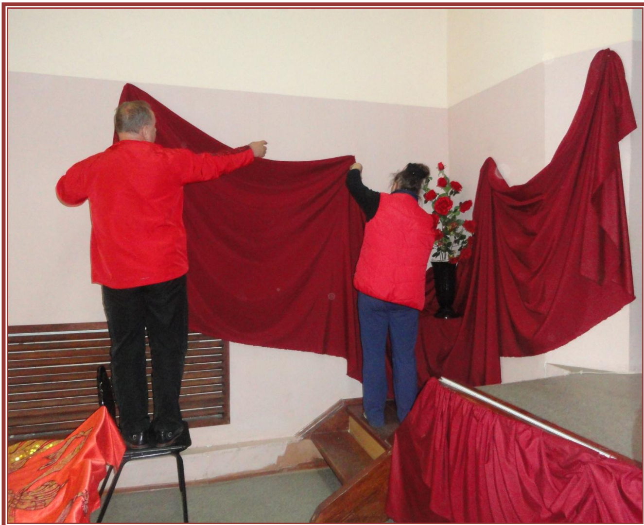
Рабочие моменты украшения стен и зала для торжественного собрания.

Много времени потребовалось для осуществления драпировки стен возле сцены с целью создания классического варианта убранства зала. Сложным оказался процесс подбора цветовой гаммы ткани и деталей декора для создания торжественности атмосферы в помещении.