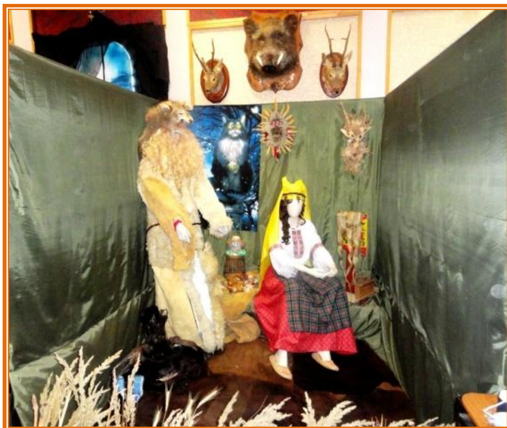
(Экспозиция «Кошки в Древней Руси» в процессе оформления)

В создание экспозиции «Кошки в Древней Руси» внесли вклад все Члены МОО.