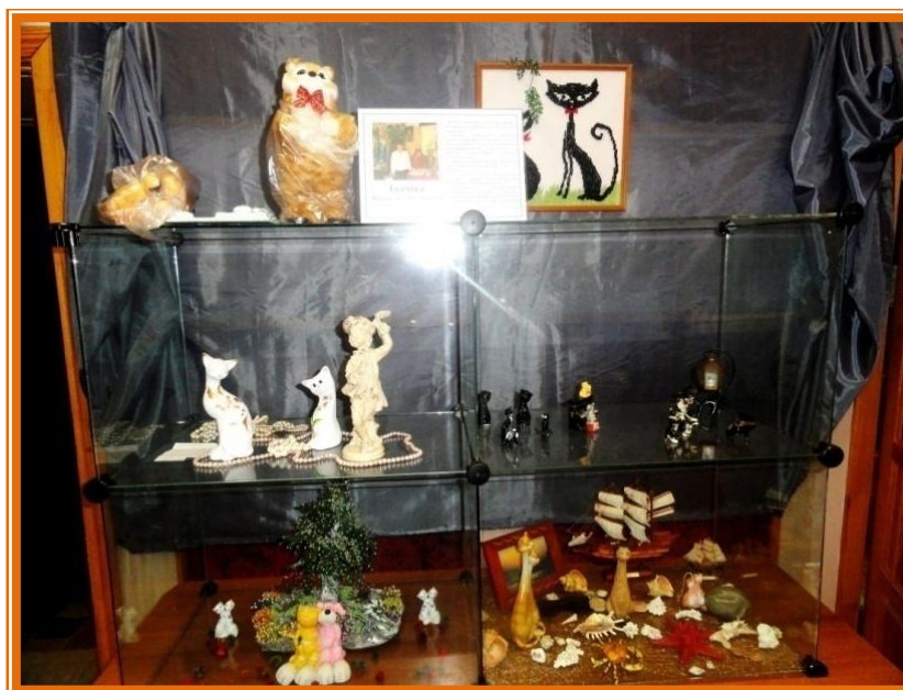
(Демонстрационные витрины в работе. Размещение экспонатов выставки.)