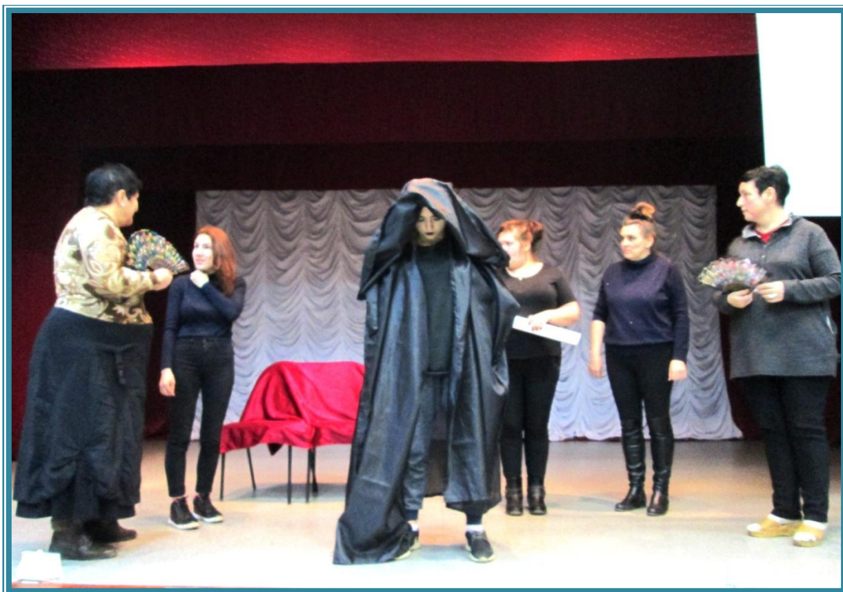
(Репетиция выхода «Посланника с планеты кошек»)