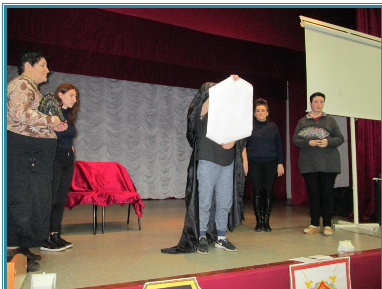
(Репетиция 6 –го действия мини-спектакля, где «Посланник» зачитывает обращение к кошкам Планеты Земля)